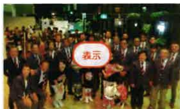
結成50周年記念式典