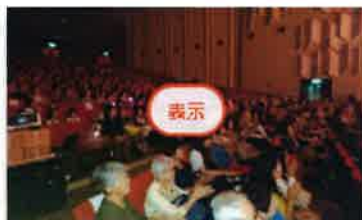
チャリティ公演会

「報告+」ボタンを選択 報告権限のある役員にのみこのボタンが表示されます (クラブ幹事及び奉仕事業委員長) 役員登録が必須