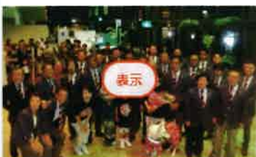
結成50周年記念式典

作成者 Hitoei NumaO Omiya Kita Oct 16, 2019