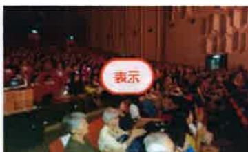
チャリティ公演会

作成者 Hitoei NumaO Omiya Kita Oct 16, 2019